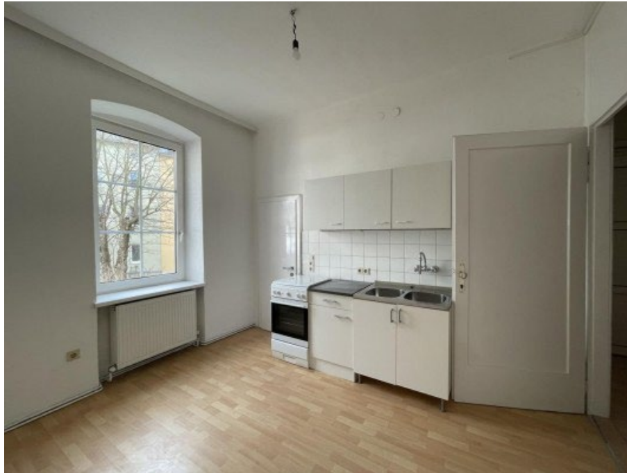
Garconniere Linz ERIMMO Einramhof Immobilien GmbH