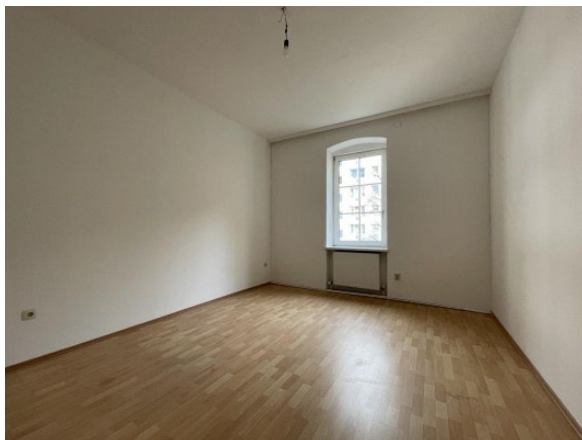
Garconniere Linz ERIMMO Einramhof Immobilien GmbH