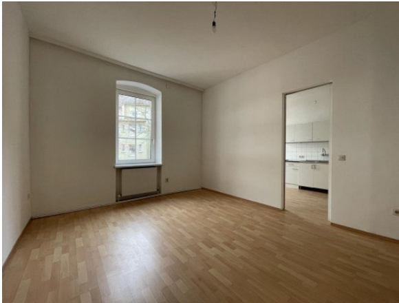
Garconniere Linz ERIMMO Einramhof Immobilien GmbH