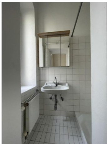
Garconniere Linz ERIMMO Einramhof Immobilien GmbH