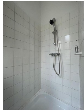
Garconniere Linz ERIMMO Einramhof Immobilien GmbH