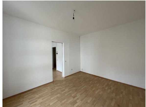
Garconniere Linz ERIMMO Einramhof Immobilien GmbH