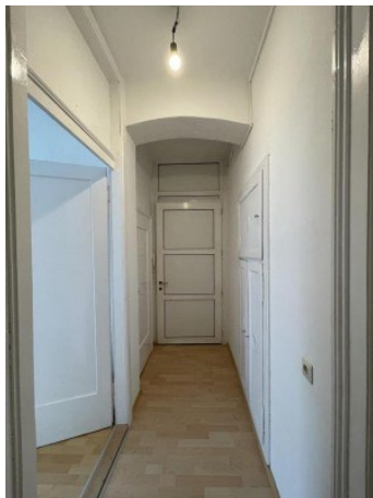
Garconniere Linz ERIMMO Einramhof Immobilien GmbH