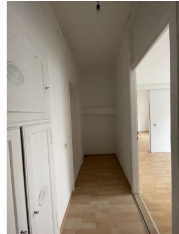
Garconniere Linz ERIMMO Einramhof Immobilien GmbH