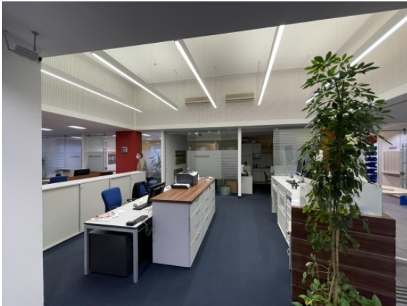
Geschäftslokal St. Florian ERIMMO Einramhof Immobi