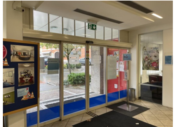
Geschäftslokal St. Florian ERIMMO Einramhof Immobi