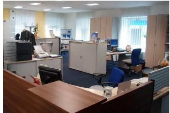
Geschäftslokal St. Florian ERIMMO Einramhof Immobi