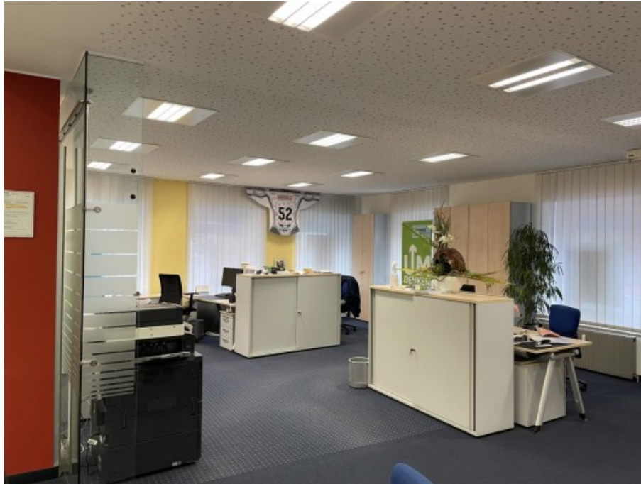
Geschäftslokal St. Florian ERIMMO Einramhof Immobi