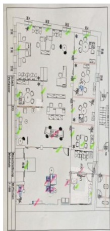
Geschäftslokal St. Florian ERIMMO Einramhof Immobi