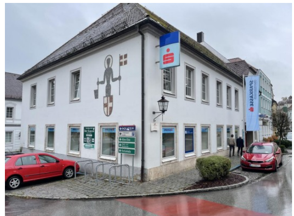
Geschäftslokal St. Florian ERIMMO Einramhof Immobi