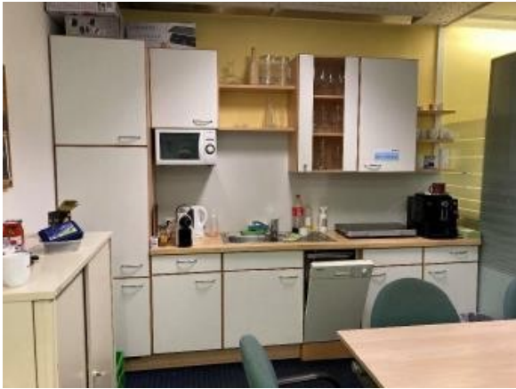
Geschäftslokal St. Florian ERIMMO Einramhof Immobi