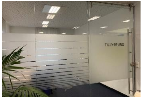
Geschäftslokal St. Florian ERIMMO Einramhof Immobi