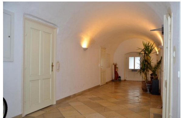
MW Enns ERIMMO Einramhof Immobilien St. Florian_7