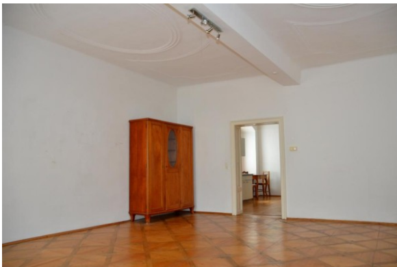
MW Enns ERIMMO Einramhof Immobilien St. Florian_6