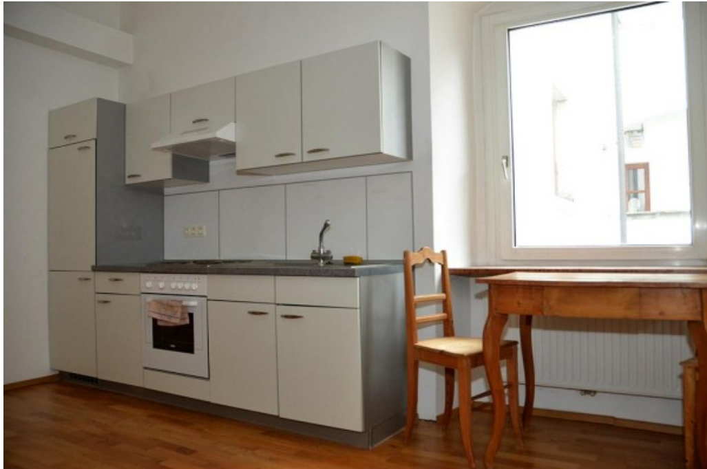
MW Enns ERIMMO Einramhof Immobilien St. Florian_1