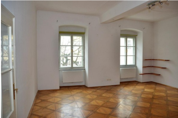
MW Enns ERIMMO Einramhof Immobilien St. Florian_2