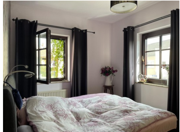
MW Enns ERIMMO Einramhof Immobilien GmbH (2)