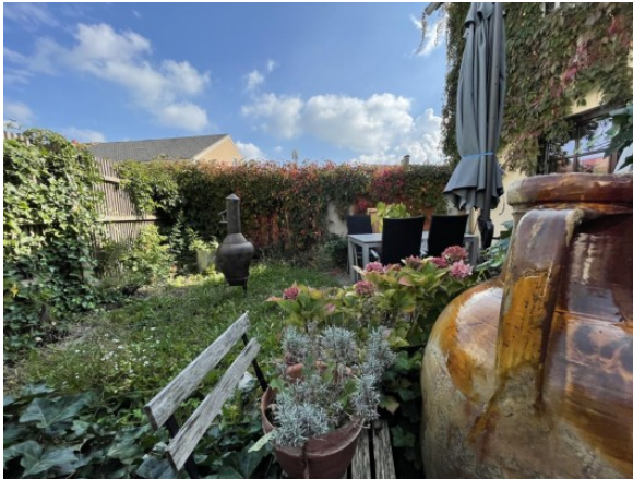
MW Enns ERIMMO Einramhof Immobilien GmbH St. Flori