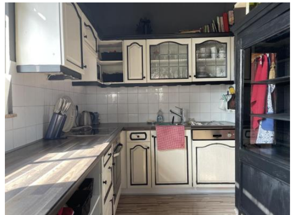
MW Enns ERIMMO Einramhof Immobilien GmbH St. Flori