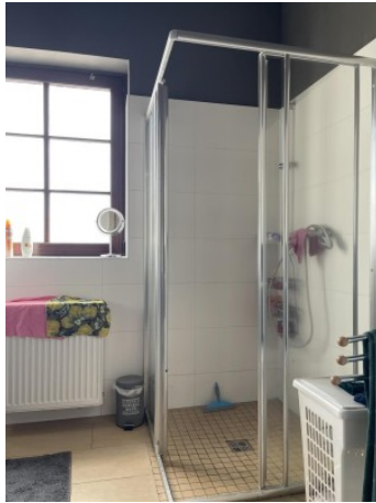
MW Enns ERIMMO Einramhof Immobilien GmbH (1)