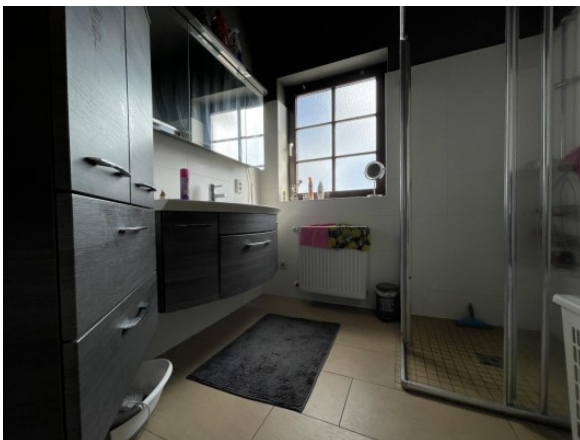
MW Enns ERIMMO Einramhof Immobilien GmbH St. Flori