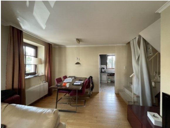
MW Enns ERIMMO Einramhof Immobilien GmbH St. Flori