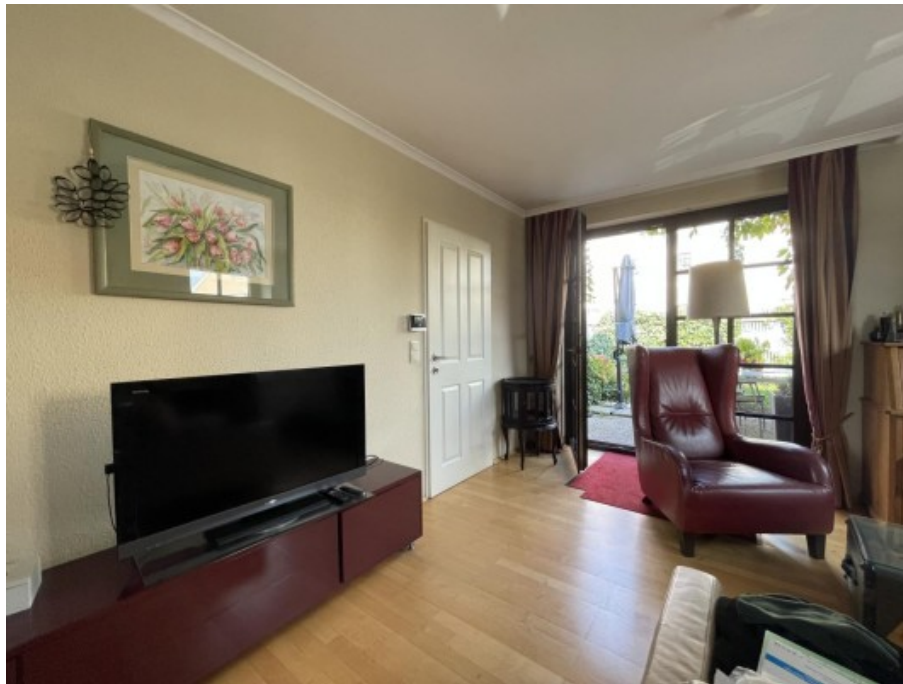
MW Enns ERIMMO Einramhof Immobilien GmbH St. Flori