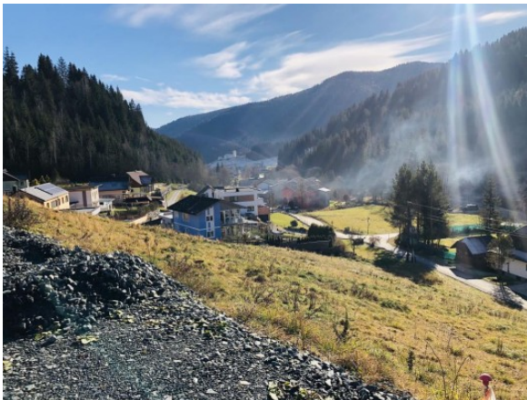
5 Grundstück Kärnten ERIMMO Einramhof Immobilien