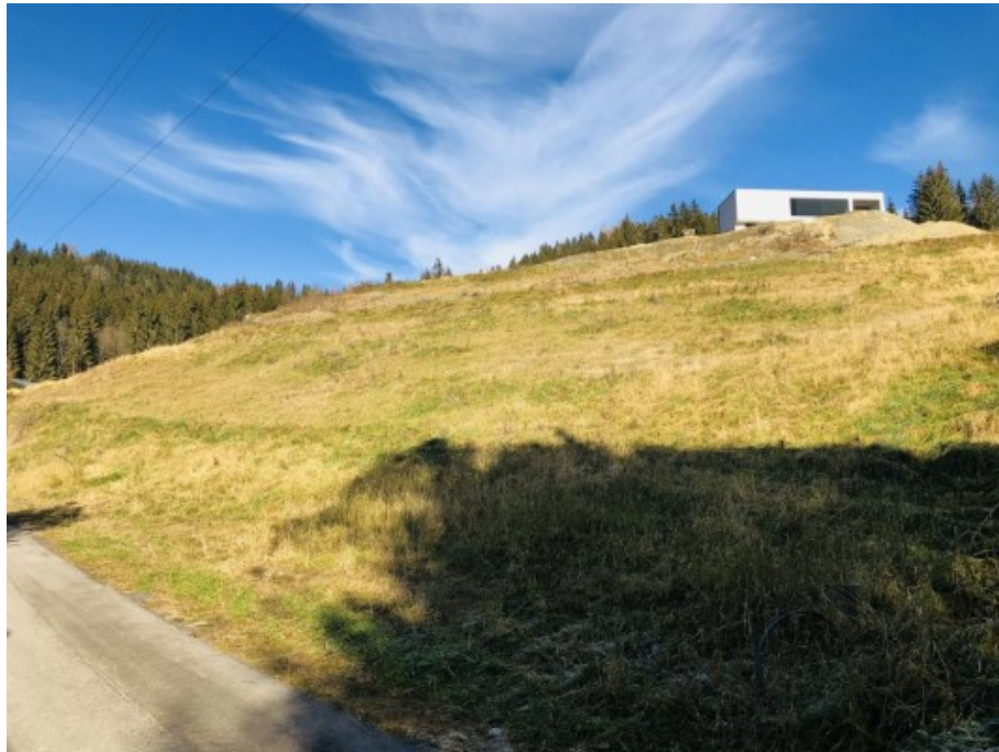
2 Grundstück Kärnten ERIMMO Einramhof Immobilien