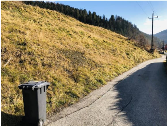
3 Grundstück Kärnten ERIMMO Einramhof Immobilien