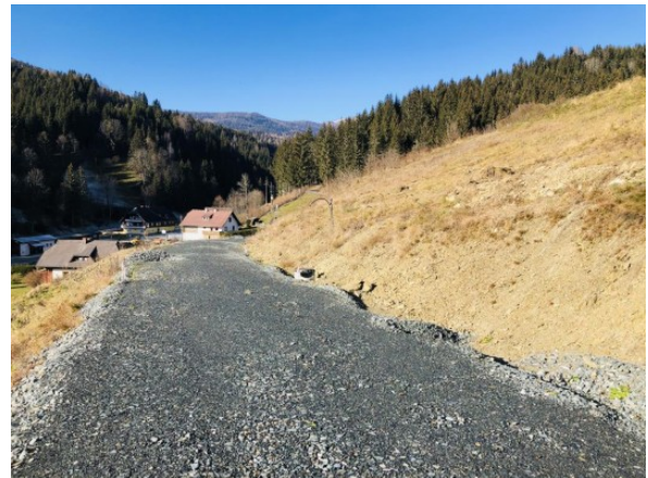
6 Grundstück Kärnten ERIMMO Einramhof Immobilien