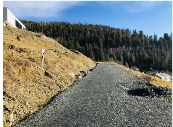
4 Grundstück Kärnten ERIMMO Einramhof Immobilien